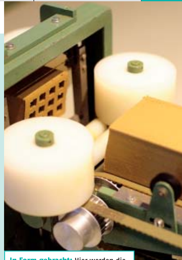
In Form gebracht: Hier werden die Minzettel geformt und geschnitten.

Von den Bausparkassen vorgegebener Sparbeitrag (monatlich meist 3 bis 5 Promille der Bausparsumme), zu dem sich der Bausparer vertraglich verpflichtet. In der Praxis können Bausparer aber auch höhere Beiträge zahlen oder eine Zeit lang mit dem Sparen aussetzen. Sonderzahlungen sind allerdings von der Zustimmung der Bausparkassen abhängig.